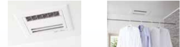
●浴室換気暖房乾燥機(ランドリーパイプ付) 暖房、衣類乾燥、涼風、換気。1台4役のスグレもの スイッチひとつで浴室が衣類乾燥室に早変わり