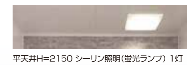
平天井H=2150 シーリン照明(蛍光灯) 1灯