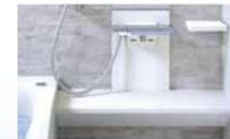
洗面器置台カウンター