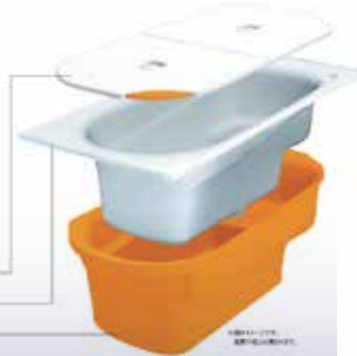
断熱構造で冷めにくい浴槽だから、お湯はり4時間後も温度の低下は2.5℃以内。夜遅くても温かく、すぐにおふろに入れます。