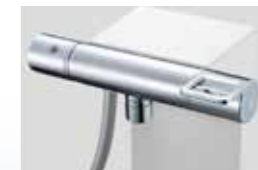
●サーモスタットカバー水栓