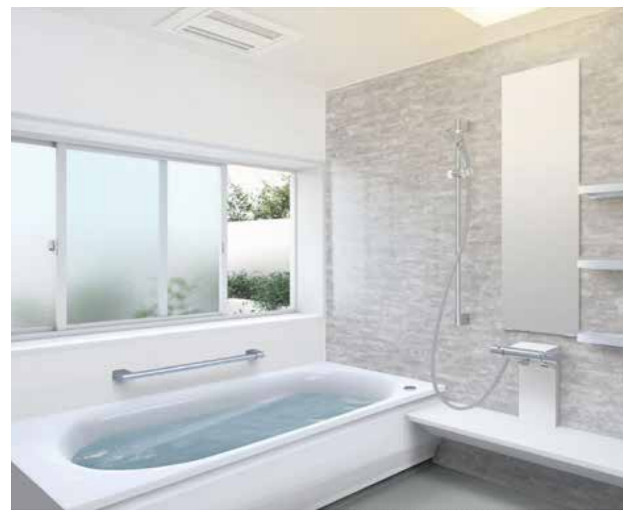
※パネルカラー：クリアライトグレー