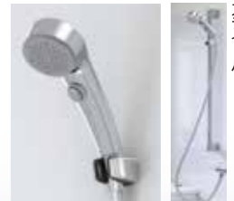
●エアインクリックシャワー 節水や省エネにも役立つ便利なシャワー