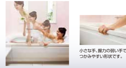
小さな手、握力の弱い手でもつかみやすい形状です。